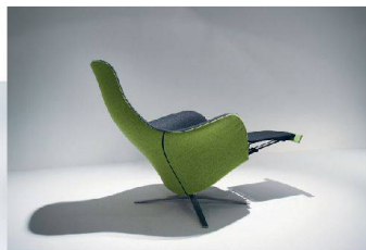
40__ Möbel, unterschiedlich gezeichnet von Stefan Westmeyer und Christophe Marchand.