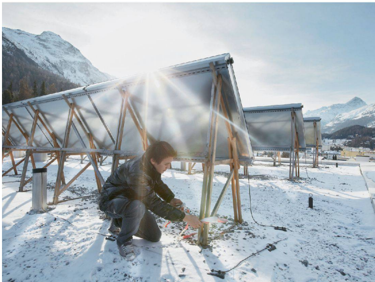
16__ Bauen mit Solarenergie? Hochparterre hats untersucht.