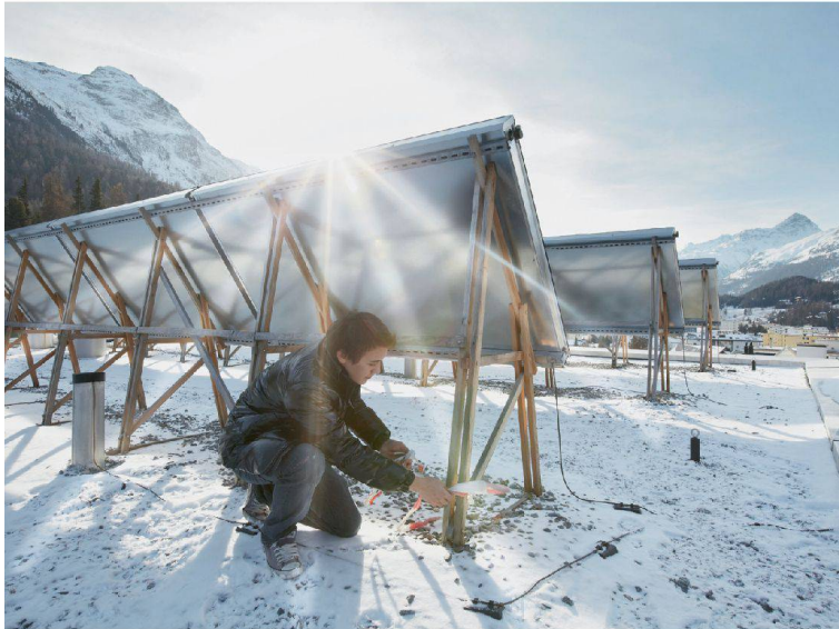
16__ Bauen mit Solarenergie? Hochparterre hats untersucht.