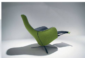
40__ Möbel, unterschiedlich gezeichnet von Stefan Westmeyer und Christophe Marchand.