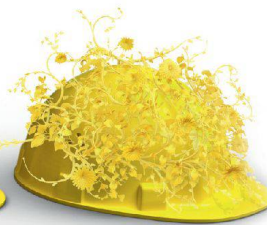
Nachhaltigkeit & Innovation

Auf die Erstellung hochkomplexer Klinker- und Sichtsteinfassaden haben wir unser Fundament gebaut. Dass wir visionär denken und entsprechend planen und realisieren, beweisen wir täglich in sämtlichen Bereichen unserer Geschäftsfelder. Wir schaffen Mehrwert, mit System am Bau: www.keller-ziegeleien.ch