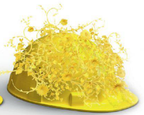
Nachhaltigkeit & Innovation

Auf die Erstellung hochkomplexer Klinker- und Sichtsteinfassaden haben wir unser Fundament gebaut. Dass wir visionär denken und entsprechend planen und realisieren, beweisen wir täglich in sämtlichen Bereichen unserer Geschäftsfelder. Wir schaffen Mehrwert, mit System am Bau: www.keller-ziegeleien.ch