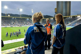
< Nah dran an der Mannschaft: Fans des FC Luzern.