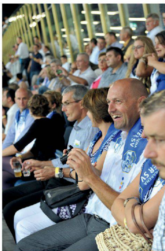
<Da lacht der Fussballfan.