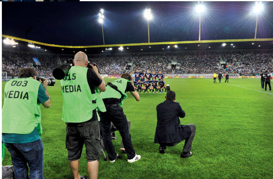
^Die Mannschaft ist der Star.