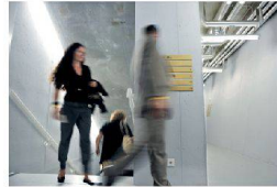
^Betonromantik im Aufstieg zum VIP-Bereich.