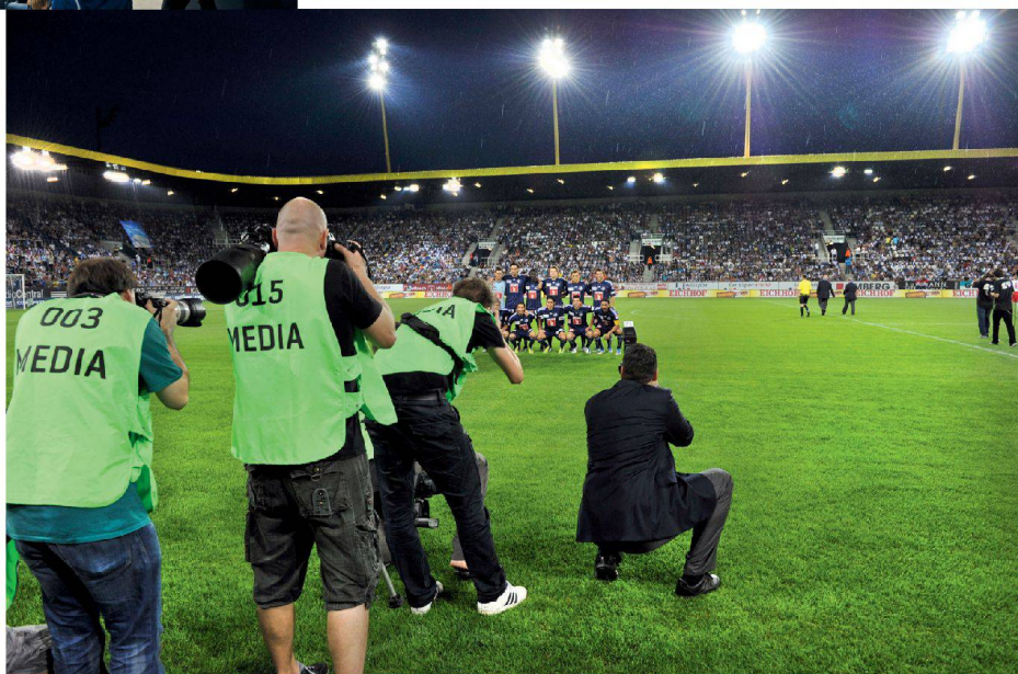
✓ Die Mannschaft ist der Star.