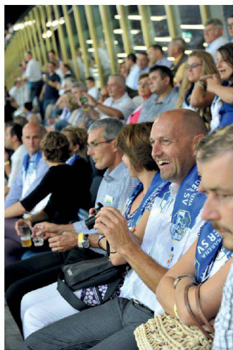
< Da lacht der Fussballfan.