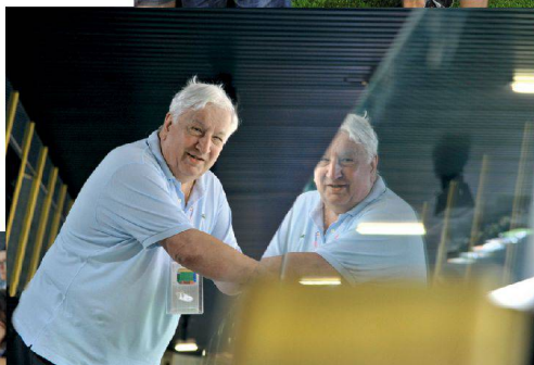
^ «Wenn nur die Klimaanlage funktionieren würde»: FCL-Meister-Ex-Präsident Romano Simioni.