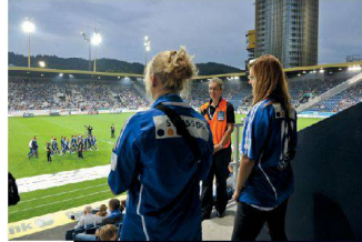
<Nah dran an der Mannschaft: Fans des FC Luzern.