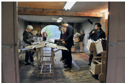
< Der Ausstellungsraum im ehemaligen Bahnhofsbuffet.