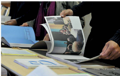
✓ Die Gäste blättern in den 19 prämierten Büchern.