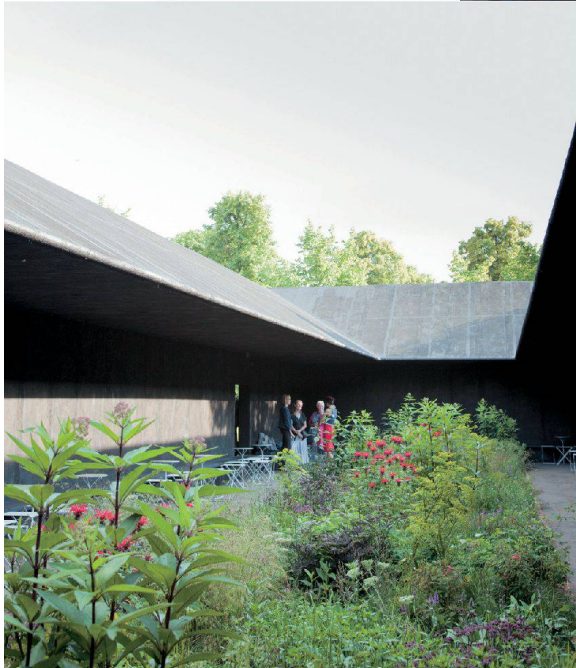
^Die Gartengestaltung stammt vom niederländischen Landschaftsarchitekten Piet Oudolf.