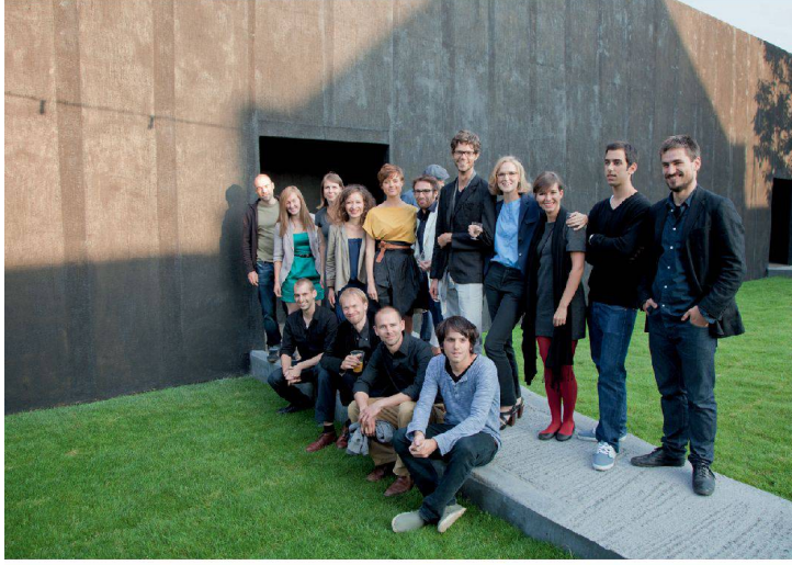
✓Sie alle arbeiten im Büro von Peter Zumthor.