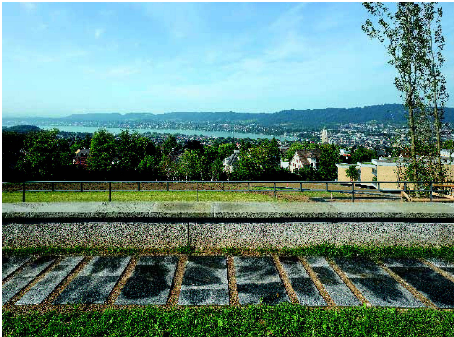
^Trotz Neubebauung bleibt der Blick auf ein atemberaubendes Panorama frei.