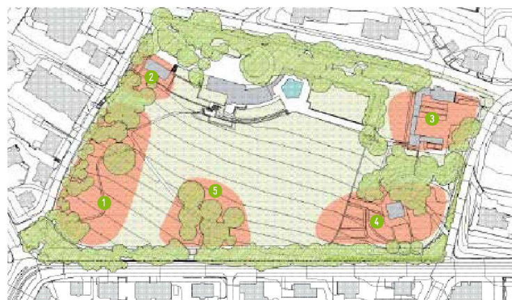
↑ Ursprüngliche Situation: Die Landschaftsarchitekten Schweingruber Zulauf definierten fünf Baufelder. Drei wurden in einer ersten Etappe überbaut.