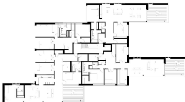
^Grundriss 2. Obergeschoss

>Der geschwungene Altbau thront über der Wiese und fängt die einmalige Aussicht ein.