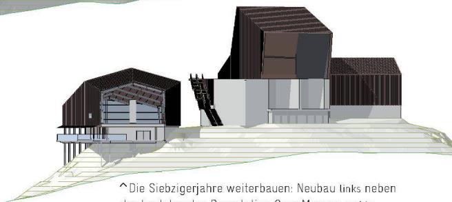
^Die Siebzigerjahre weiterbauen: Neubau links neben der bestehenden Bergstation Crap Masegn rechts.