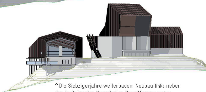
^ Die Siebzigerjahre weiterbauen: Neubau links neben der bestehenden Bergstation Crap Masegn rechts.