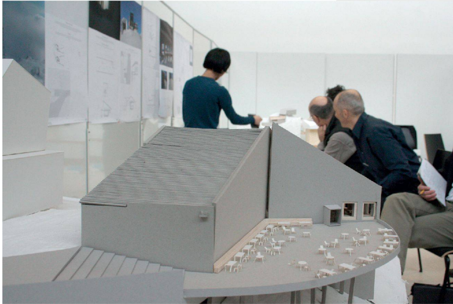
^Bildstarker Entwurf – aufmerksame Juroren.