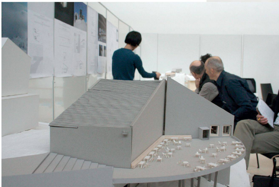
^ Bildstarker Entwurf – aufmerksame Juroren.