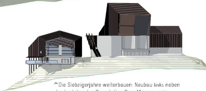
^ Die Siebzigerjahre weiterbauen: Neubau links neben der bestehenden Bergstation Crap Masegn rechts.