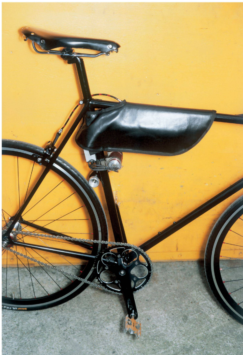
^EL Primo zeigt, wie aus einem normalen Stadtvelo ein puristisches E-Bike wird, das seine Kraftreserven züchtig verhüllt.