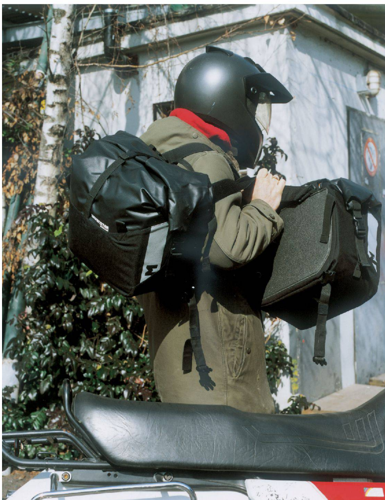
<Robust, praktisch – und sieht auch so aus. Die Satteltasche für den Motorrad-Cowboy.