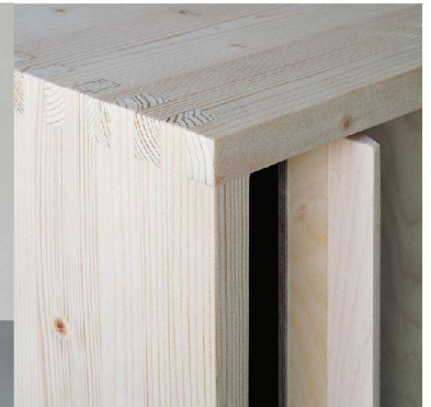
Bild: 2 Schränke, Türen farblackiert.

Der Schrank zur vielseitigen Verwendung als Kleider-, Garderoben-, Büroschrank in Massivholz Tanne natur. 2 Schiebetüren und Rückwand in hellem Sperrholz.