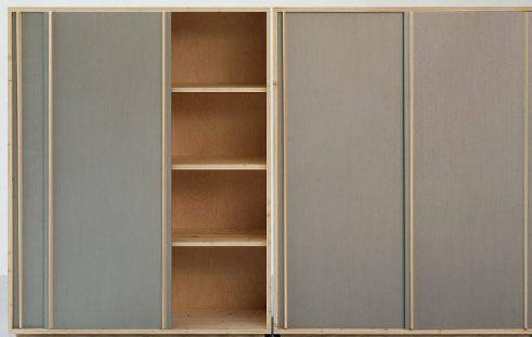
Bild: 2 Schränke, Türen farblackiert.