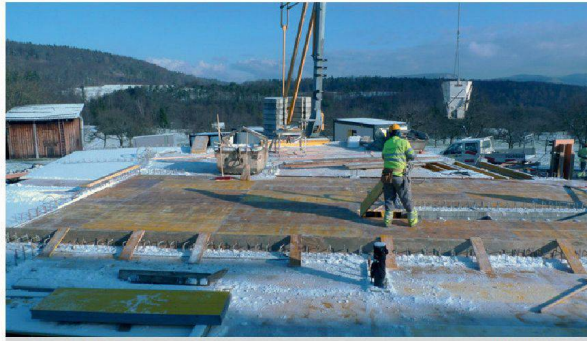
Construction of House D proceeds... More 3 / 5 Prev Next