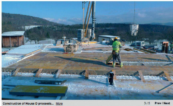
Construction of House D proceeds... More 3 / 5 Prev / Next