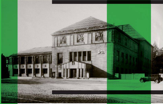
Kunsthhaus Zürich nach 1925, OS Zentralbibliothek, Zürich