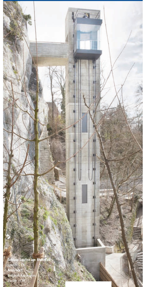
Schluss Laufen am Rheinflall Laufen - CH Architekt: Bellprat Associates Zürich - CH

ORTSTERMIN am Rheinflall Hochparterre, Emch und TEC21 laden ein 17. Juni 2010, 16.15 Uhr Anmeldung und Info ortstermin@emch.com