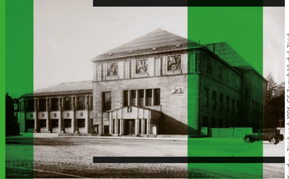
Kunsthaus Zürich nach 1925, GS Zentralbibliothek Zürich