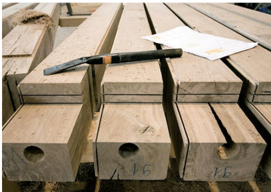
^Auch dünne Stämme werden zu Balken: Das kernlose Laubholz trocknet schneller und reisst weniger stark.