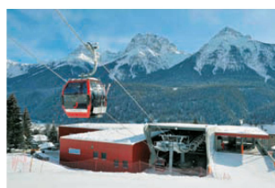
« Das Truckli im Tal: Die Talstation der Gondelbahn Motta Naluns in Scuol GR.