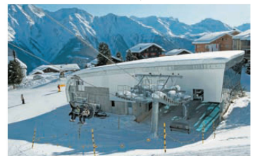
✓ Versteckt im Hang: die Sesselbahn Hohfluh auf der Riederalp VS.