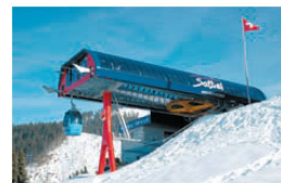
« Ein Modul für überall: Die Bergstation der Gondelbahn Hochstuckli in Sattel SZ.