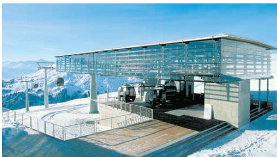
« Gestaltete Hülle: die Bergstation der Gondelbahn Nagens bei Flims von Marcus Gross und Werner Rüegg von 1997.