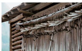
<23_Heinzengerüst am Heulager.