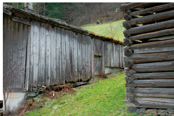
>23_Montafoner Ensemble mit Stall und Heulager.