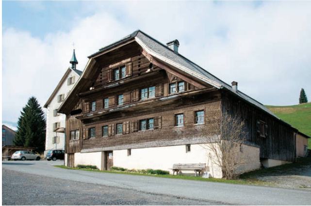
<21_Schwarzenberg: Das voluminöse Kleber-Haus, erbaut 1556, ist heute ein Museum.