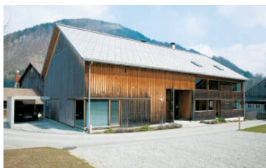
^22_Mellau: das Haus Moosbrugger.