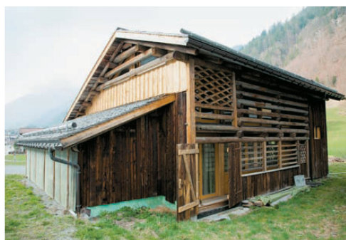
^23_Aussen fast noch Stall, innen Wohnraum.