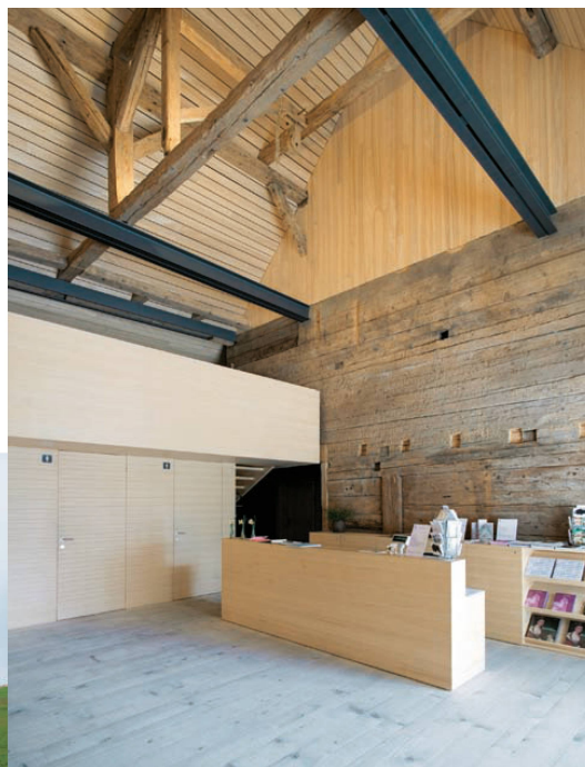
<21_Der Heustall, Stahlträger verstärken die Holzbalken.