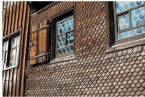
^21_Butzenfenster und Schindelbe- schlag, die typischen Attribute.