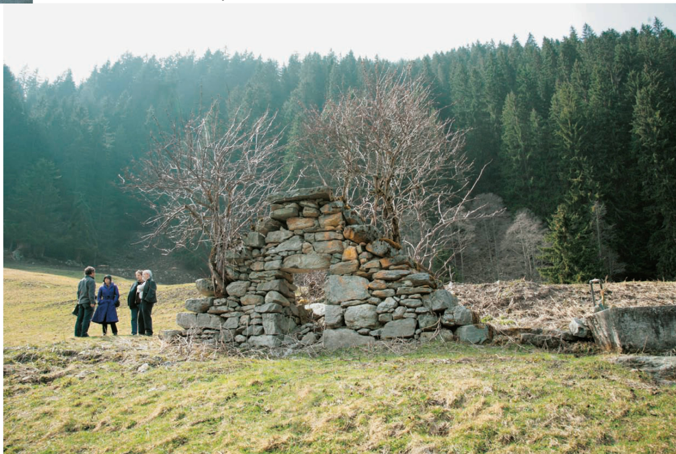
✓23_Mahnmal für Verschwundenes am Saumweg, der Via Valtellina.