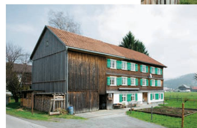
<Andelsbuch: Haus Nr. 154, der Wohntrakt wurde nachträglich zum Stall hin erweitert.