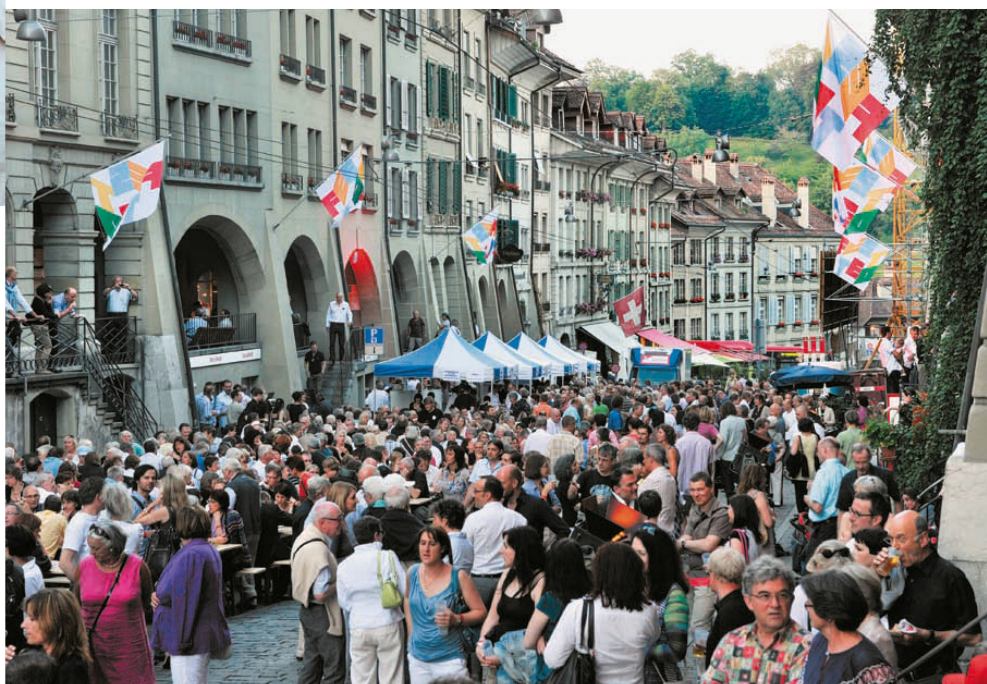
^Die Berner Gerechtigkeitsgasse im Festrausch, was sie aber keineswegs wanken lässt. Später in der Dunkelheit wird sie rot, da von unten angestrahlt.