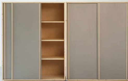
Bild: 2 Schränke, Türen farblackiert.