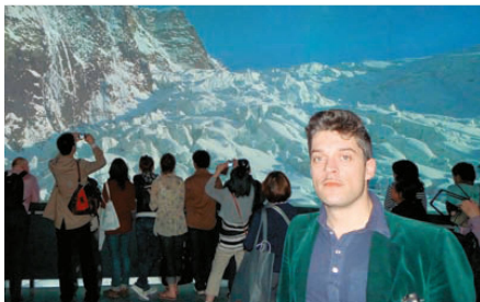
<Komponist Benedikt Schiefer hat die Geräuscharchitektur des Pavillons gestaltet.