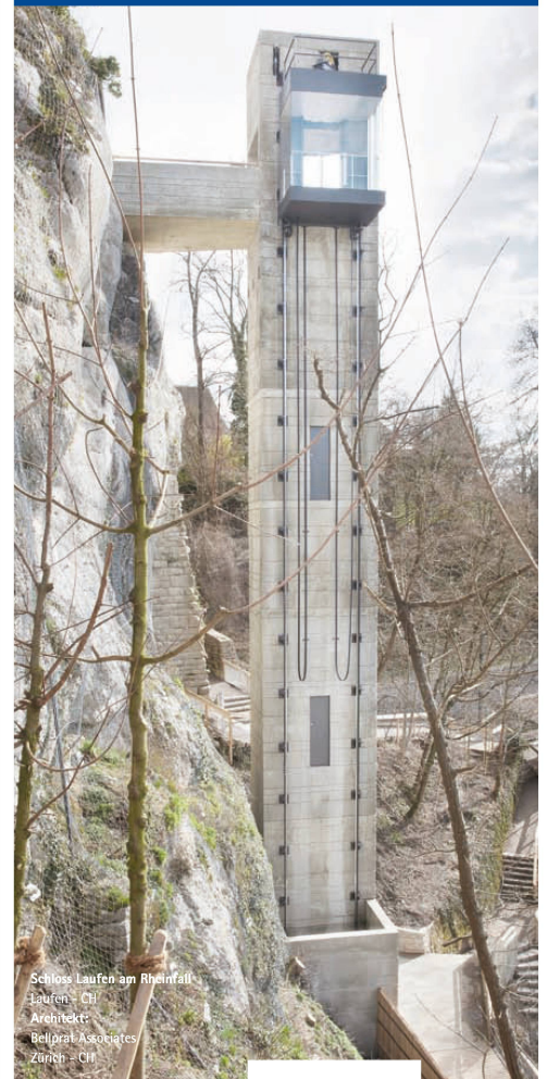
Schloss Laufen am Rheinfall Laufen - CH Architekt: Bellprat Associates Zürich - CH

ORTSTERMIN am Rheinfall Hochparterre, Emch und TEC21 laden ein 17. Juni 2010, 16.15 Uhr Anmeldung und Info ortstermin@emch.com