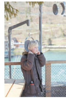
<Eine «Hörinstallation», die nicht gegen das Brausen ankommt.