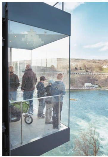
<Lift mit Aussicht: glücklich, wer die richtige Seite erwischt.