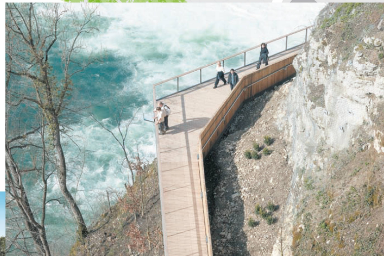
^Ob im Lift, auf dem Steg oder dem Weg: Das brodelnde Wasser ist stets Mittelpunkt.