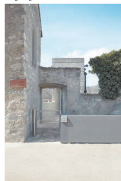
✓ Warten auf Besuchermassen: die massive Abschränkung vor dem Zugang zum Lift.