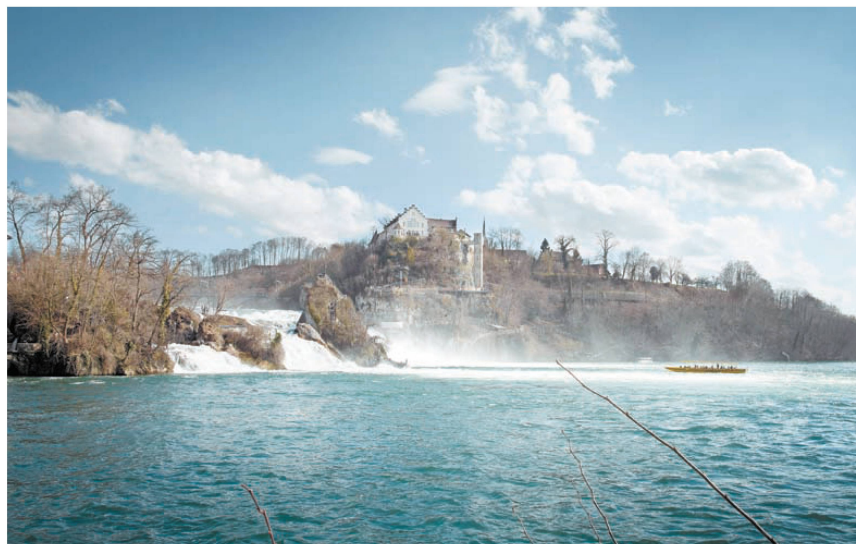
^Das Wasser, die Känzeln und das Schloss: Ein neuer Lift verbindet sie.

Die Reise in der dreiseitig verglasten Liftkabine macht aus der letzten Etappe des Wegs ein Erlebnis – sofern man auf der dem Rhein zugewandten Seite fährt und nicht mit Blick auf den Hang. Kein stolzes Ingenieurbauwerk haben sich die Gestalter vorgestellt, was auch die Denkmalpflege »