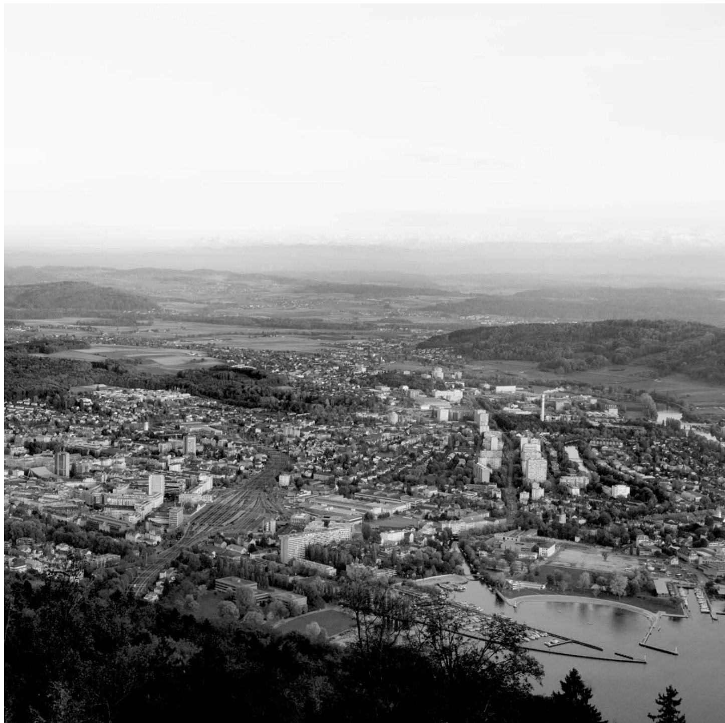
^Biel gehört zu zwei Landschaften: zur Ebene des Seelands und zum Jura. Der Blick von Magglingen aus geht in die Tiefe zum See und in die Weite zu den Alpen.