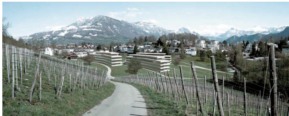
^Flossmatt: grosse «Sichträume» zwischen den Wohnzeilen von Iwan Bühler und Scheitlin-Syfrig + Partner.