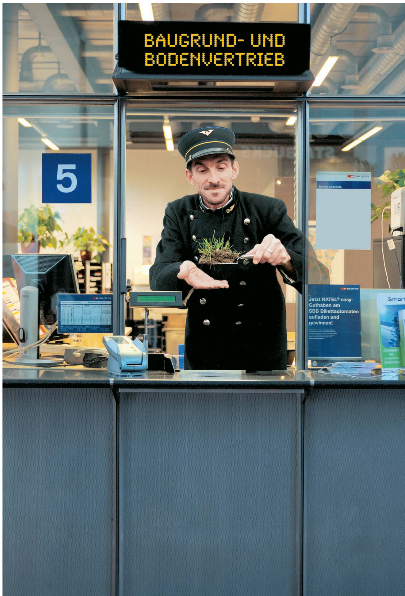
^SBB Immobilien verteilen ihren grossen Bodenkuchen an Private.