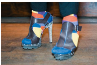
<Die auffälligsten Schuhe des Abends. Oder waren es die Strümpfe?