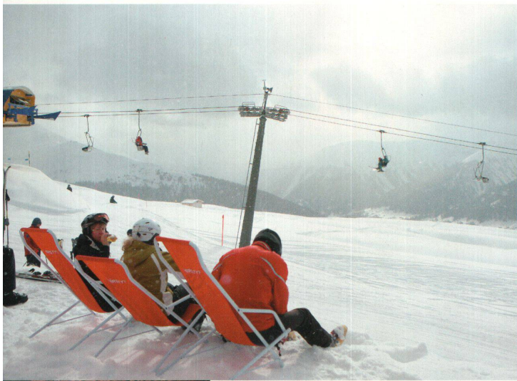
^ Nur das Wetter hat nicht mitgemacht: Kaum Sonnenstrahlen drangen zum Basis-Camp.