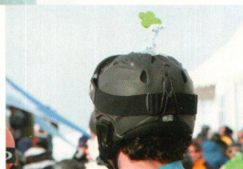
^ Glück spielte am Renntag eine nicht unerhebliche Rolle.