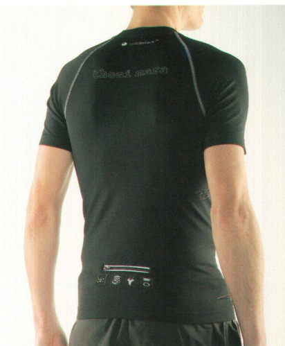
<Textile Design Award: 50 000 Franken gehen an Schoeller Technologies für die Textilausrüstung «Coldblack».