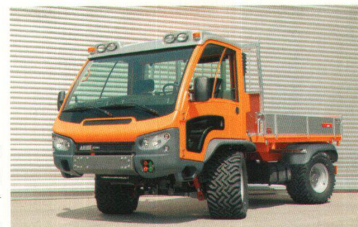
>Market: 35 000 Franken gehen an Paolo Fancelli für den Mehrzwecktransporter «Aebi VT 450».