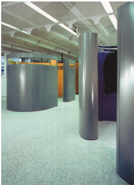
<Die Garderobe hat sich eingerollt.