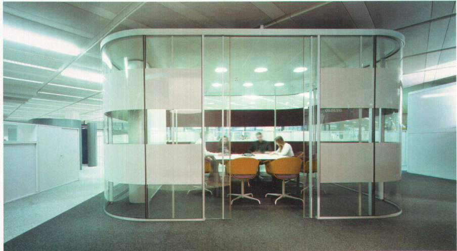
✓«Sehen und gesehen werden» gilt im verglasten Think Tank.