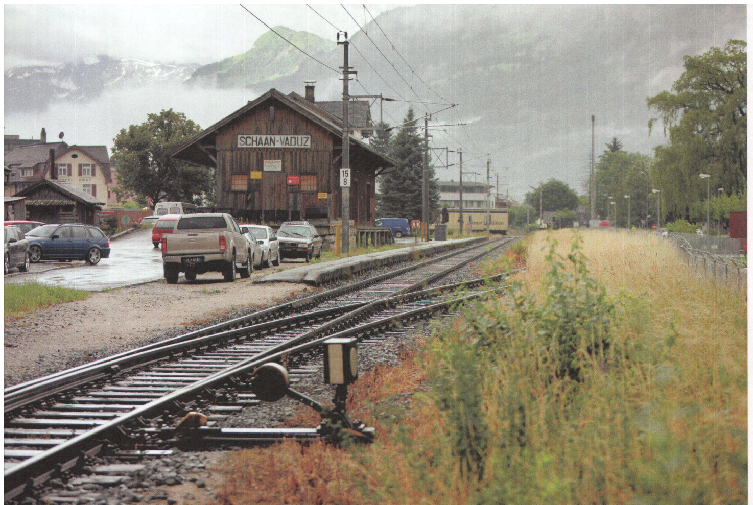
^Eingleisig fährt die Eisenbahn durchs Fürstentum Liechtenstein von Buchs nach Feldkirch.