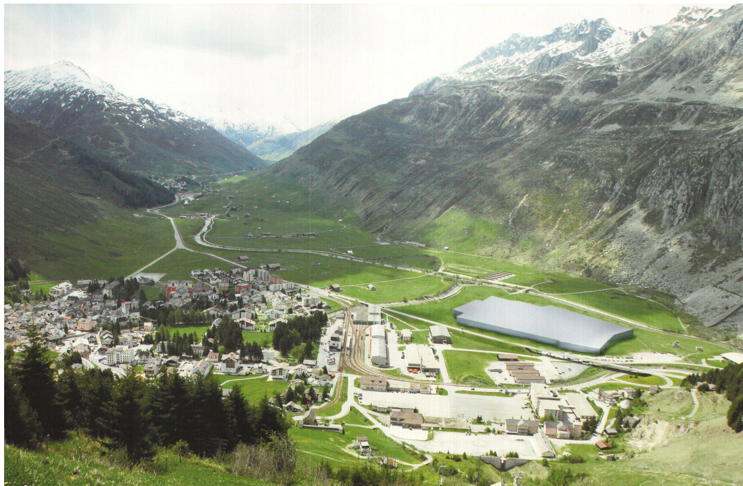
^ Ungefähr so gross wird das Podium. Sichtbar bleiben nur die Einfahrten, der Rest wird zugedeckt und überbaut.