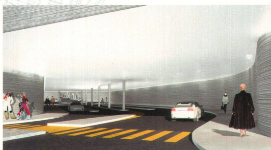
< Kühl-elegant, aber austauschbar: das Garagengeschoss. Man beachte die Kleidung.