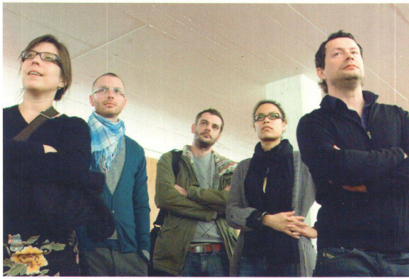
^ Aufmerksames Publikum: ausgebildete und studierende Architektinnen und Architekten während der öffentlichen Kalkbreite-Jurierung.