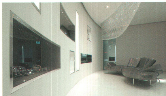
<In diesen Innenräumen finden die Beratungen der Messekunden statt.