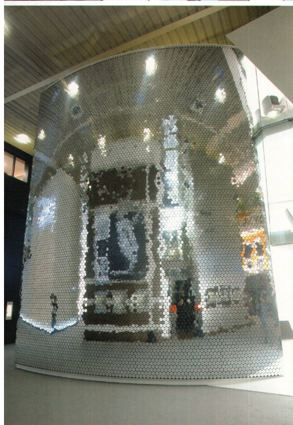
^Die komplette Wand besteht aus 16 000 Aluschuppen, die sich einzeln und geräuschlos bewegen lassen.