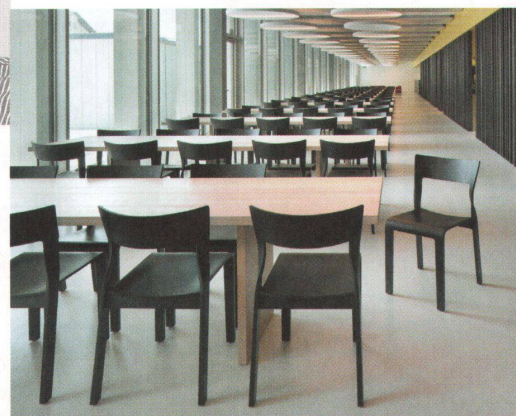
^ Stuhl «Torsio» von Hanspeter Steiger.