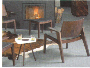
✓Sessel und Beistelltisch «Muscat» von Greutmann Bolzern.