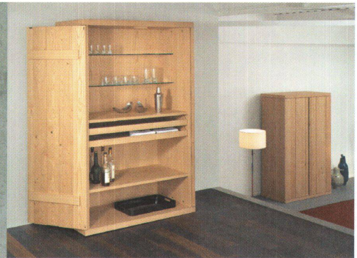
^Schrank «Plusminus» von Hans-Jörg Ruch.