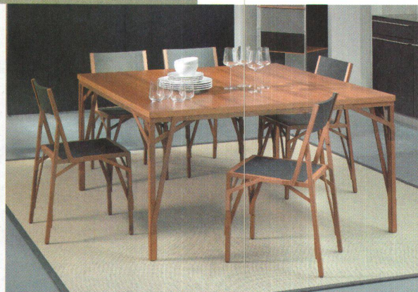
<Atelier Oi entwarfen die Tisch- und Stuhlbeine von «Allumette» als filigranes Fachwerk.