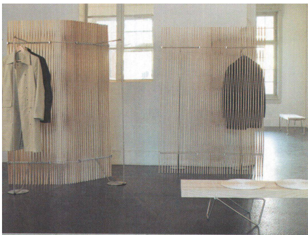
<Bank und Paravent «Plus» von Atelier Oi entstammen demselben Prinzip.