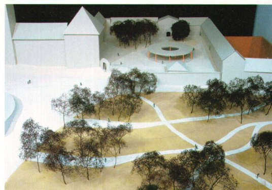
^Blick in den Weisswindgarten und in den Abteihof mit dem Pilgerunterstand.

Überhaupt: Wie umgehen mit der Steilheit des Platzes? 12 Meter liegt der Eingang der Klosterkirche höher als das Ende der Hauptstrasse. Um schräge Fläche in den Griff zu bekommen, haben die Landschaftsarchitekten von Günther Vogt ein Karton- und Sandmodell im Massstab 1:100 gebaut. Die Jury war überrascht, wie einheitlich das Projekt wirkt, trotz der vielen Teilbereiche. Der offene Raum ist das Verbindende, neuer Horizont ist der Klosterwald und nicht mehr die Mini-golfanlage. Kritik äussert sie bei der Gestaltung des Abteihofs. Der sei noch zu überladen und der Pilgerunterstand zu gross.