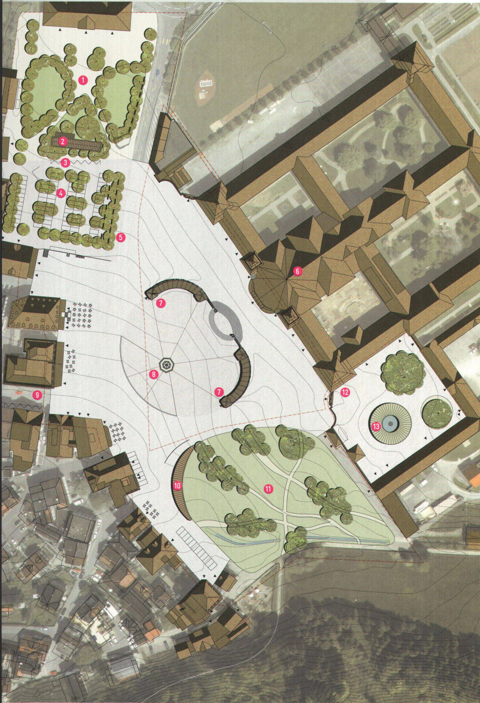
^ Masterplan mit eingezeichnetem Wettbewerbsgebiet: Das Siegerprojekt formt um den Marienbrunnen einen «Platz im Platz».