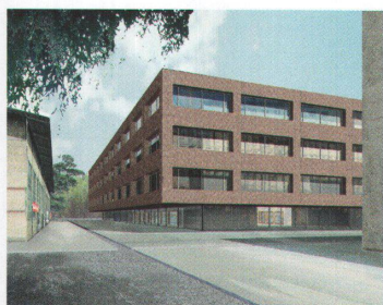
Von Roll-Campus, Bern