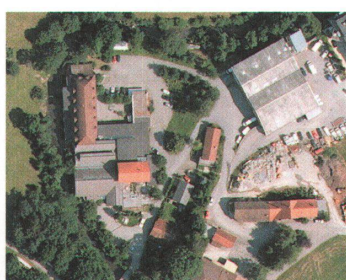
Fabrik am Rotbach, Bülhel

Auf einem Teil des Von Roll-Areals im Länggassquartier bauten private Investoren Wohnungen. Drei bestehende Gewerbebauten werden weiter genutzt. Das übrige Areal will der Kanton Bern zum Campus für Uni und Pädagogische Hochschule umnutzen. 2004 fand dafür ein Architekturwettbewerb statt.