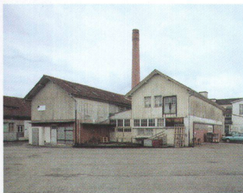
Bürstenfabrik Walther, Oberentfelden