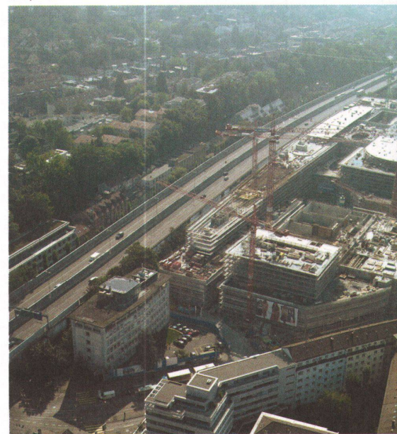
22. September 2005