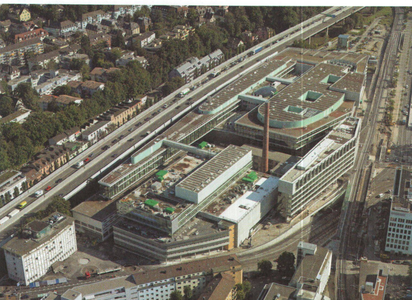
21. September 2006