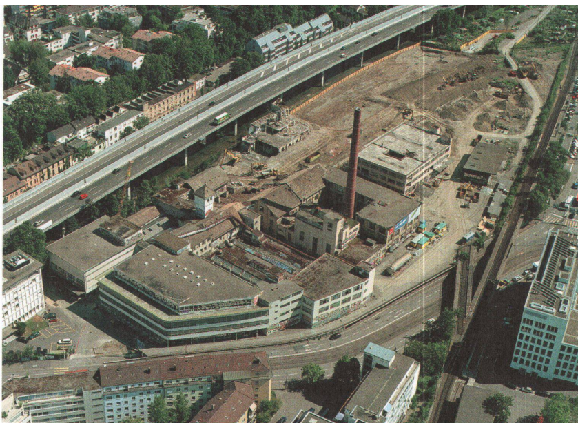
19. August 2003