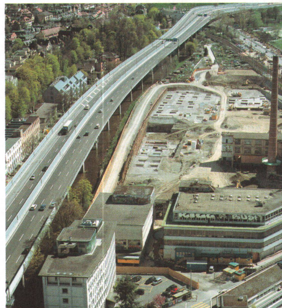
20. April 2004