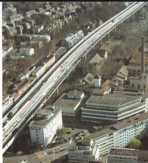
11. März 2002

Eine 300 Meter lange Spundwand riegelte das Grundwasser gegenüber der Sihl ab. Der gesamte Aushub erfolgte in einer offenen Baugrube, 300 Meter lang und zwischen 75 und 130 Metern breit. Das Gebäude der Ausrüsterei und der Hochkamin mussten unterfangen werden, was vor allem beim Kamin den Ingenieuren Vorsicht abverlangte. Der Komplex Sihlcity liegt über dem mittleren Grundwasserspiegel, wo nicht, waren umfangreiche Massnahmen nötig, um einen Grundwasserrückstau zu verhindern. Die Prunkstücke der Bauingenieure sind das weit auskragende Parkhausdach und die Spiralrampen darunter. Mit einer Deckenstärke von nur 50 cm bei einer Auskragung von bis zu 15 Metern wirkt das Dach entmaterialisiert und schwebend. Dies war nur mit fünf von unten unsichtbaren Überzügen möglich. Zuerst wurden die kreisrunden Kerne der Rampen betoniert, deren Wände 50 cm dick sind. Anschliessend folgten die Rampen und am Schluss die Brüstungen. Auch bei den Hochbauten sind die Zahlen eindrücklich: zum Beispiel rund 120 000 m 3 Beton, 295 000 m 2 Schalung, 10 600 Tonnen Armierungsstahl und 1630 vorfabrizierte Stützen waren für den Bau von Sihlcity nötig. •