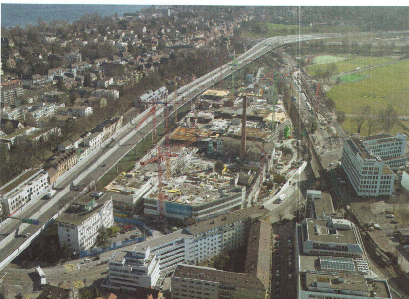
16. März 2005