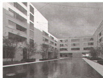
1 Zürich, Etzelstrasse / Mutschellenstrasse: Wohnen und Gewerbe, 1960, «Sima».