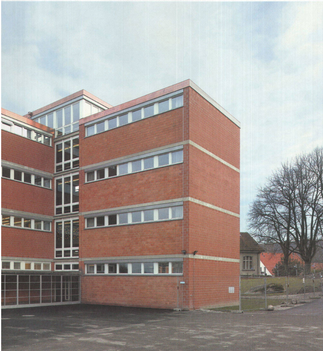
Die neu aufgemauerten Westfassaden (nach rechts blickend) sind homogener und etwas dunkler als die Originalfassaden.