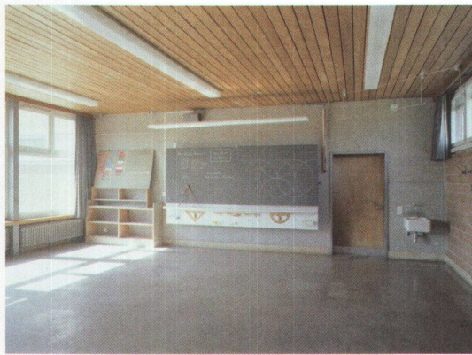
1 Klassenzimmer nach der Sanierung: Die neue Decke gibt dem Raum mehr Weite. An der Backsteinrückwand stehen die tragenden Stahlstützchen.

Die erste Sanierungsetappe mit dem viergeschossigen Sekundarschulhaus, der Turnhalle und dem Bibliothekstrakt ist abgeschlossen, zurzeit sind die Bauarbeiter im Primarschulhaus und im Singsaal am Werk. Bei der fertigen Etappe sind die Unterschiede zum ursprünglichen Bild minimal: Die neuen Westfassaden sind etwas dunkler, die Farbe homogener als bei den Originalwänden, weil der Ton aus einer anderen Grube stammt. Und die äusseren Aluminiumfensterprofile, deren Proportionen mit dem hölzernen Original praktisch übereinstimmen, glänzen etwas mehr in der Sonne. Roland Gross, der vor fünfzig Jahren die Schulanlage plante, ist zufrieden: «Es sieht aus, wie wenn man nichts gemacht hätte.» •