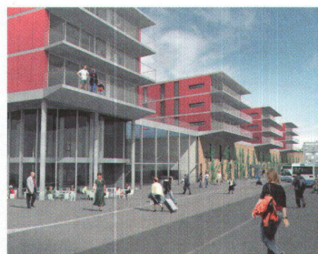
Überbauung «Mittim» 7

Das Hotel kommt neben das Parkhaus 1 zu stehen und bildet den baulichen Auftakt des Flughafens an der Hauptschlagader des landseitigen Verkehrs. Sowohl im Erd- als auch im 2./3. Obergeschoss umgeben Strassen den dunklen, im Grundriss quadratischen Block. Auf der Höhe der Vorfahrt liegt die Réception, die sich mit den Restaurants und Bars um den Innenhof gruppiert. Panoramalifte erschliessen die 329 Hotelzimmer im 1. bis 6. Obergeschoss. Im 7. Stock liegen Konferenzräume. Die drei obersten Geschosse sind Büros und Dienstleistungen vorbehalten, im Untergeschoss gibt es ein Entertainmentbereich. Visualisierung: Atelier WW --> Adresse: Zürich-Flughafen --> Fertigstellung: 2008 --> Bauherrschaft: Zurich Airport Investment, Zürich-Flughafen --> Architektur: Atelier WW, Zürich --> Gebäudevolumen: 163 000 m³