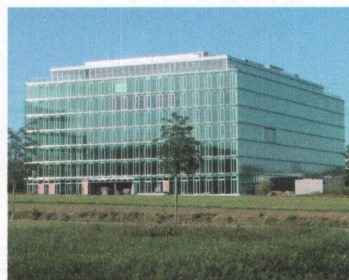
Geschäftshaus «Lightcube» 3

Der Park ist das Herz Leutschenbachs. Er wertet das einstige Industriegebiet auf und gibt dem Wohnquartier ein Gesicht. Einzelne Elemente erzeugen einen fliessenden Raum. Auf dem chaussierten Platz kann man Boule spielen und Quartierfeste feiern; in der Spiellandschaft gibt es eine Senke, einen Hügel und Spielgeräte. Im Osten liegt die Spiel- und Liegewiese mit Wasserbecken. Den mit Altlasten belasteten ehemaligen Kugelfang darf man nicht betreten. Eine Sitzwand verhindert den Zugang zum Hügel und bildet einen Baumtopf. 3D-Bild: Christopher T. Hunziker --> Adresse: Leutschenbachstrasse --> Fertigstellung: 2008 --> Bauherrschafft: Grün Stadt Zürich --> Planergemeinschaft: Dipol Landschaftsarchitekten, Basel; Christopher T. Hunziker, bildender Künstler/Architekt, Zürich --> Parkfläche: 15 236 m 2