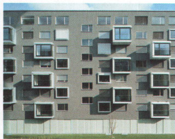
Wohnen im Andreasark 1

Das Steiner-Hunziker-Areal bietet Platz für 800 Wohnungen. Im Rahmen des von ihnen erarbeiteten Leitbildes bauten die Architekten Bob Gysin + Partner BGP in der ersten Etappe 160 Wohnungen. Zwei L-förmige Gebäude umschliessen einen Wohnhof, öffentliche Erdgeschossnutzungen sollen für ein lebendiges Quartier sorgen. Alle Wohnungen sind zweiseitig orientiert; die Erker blicken wie herausgezogene Schubladen aus dem Gebäude und geben der Fassade ihr Gesicht. Foto: David Willen --> Adresse: Hagenholzstrasse, Zürich --> Fertigstellung: 2005 --> Bauherrschafft: Credit Suisse Asset Management, Real Estate Asset Management, Zürich --> Architektur/Generalplaner: Bob Gysin + Partner BGP, Zürich --> Landschaftsarchitektur: Schweingruber Zulauf, Zürich --> Gebäudevolumen: 128 600 m 3