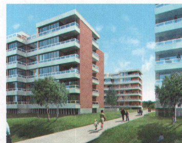
Wohnen am See 4

Das «Lightcube» ist ein Pionier: Es ist das erste bewilligte Bauprojekt im Glattpark, dem ehemaligen Oberhauserried. Das achtgeschossige Geschäftshaus ist in eine Aluminium-Glas-Fassade gehüllt. Der Haupteingang des «Lightcube» liegt unmittelbar bei der Haltestelle «Stelze» der zweiten Bauetappe der Glattalbahn. Das Herz des Gebäudes ist der über alle Geschosse reichende Innenhof; zwei hängende Gärten im 1. und 3. Obergeschoss sorgen – fluglärmgeschützt – für Licht und Luft. Die Gebäudestruktur ermöglicht die Realisierung unterschiedlicher Raumkonzepte. --> Adresse: Glattpark, Opfikon --> Fertigstellung: 2007 --> Bauherrschafft: Allreal Office, Zürich --> Totalunternehmung: Allreal Generalunternehmung, Zürich --> Architektur: Leuner & Zampieri Architekten, Aarau --> Gebäudevolumen: 72 280 m 3