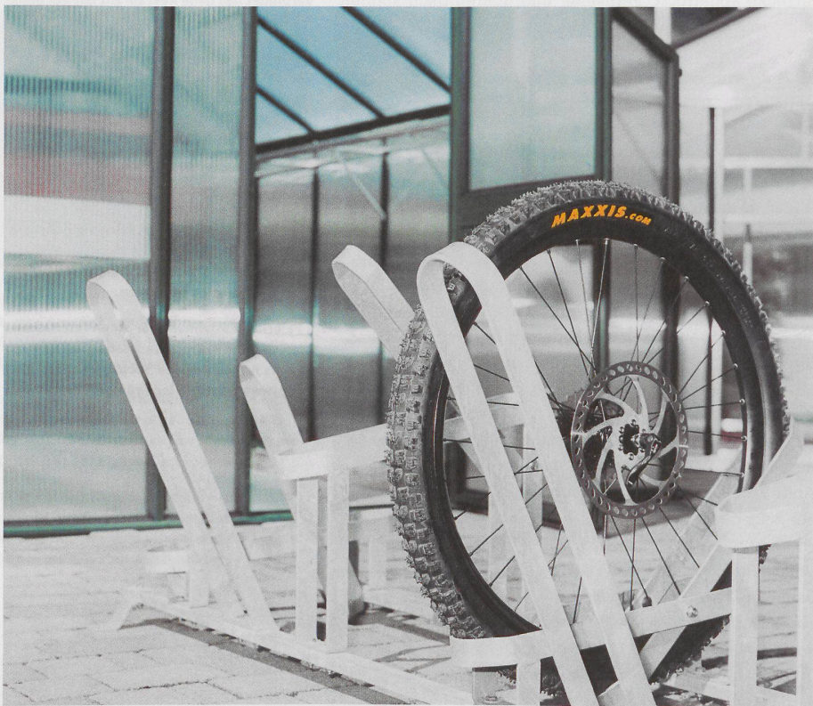
Dieser Fahrradständer ist nett zum Fahrrad. Er hält das Rad dort, wo es ihm am wenigsten weh tut: am Pneu.