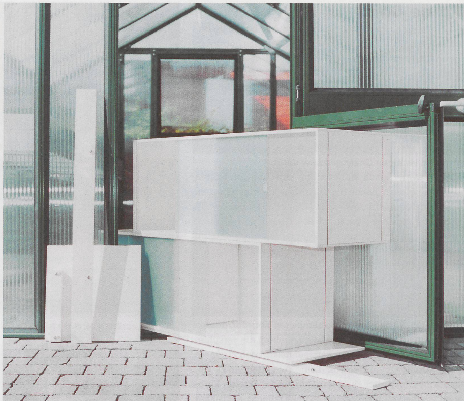
Behälter zusammenspannen, mit Kugeln übereinanderstapeln und Schiebetüren rein: Fertig ist das Regal.

--> Bezug: Fachhandel oder www.xilobis.ch