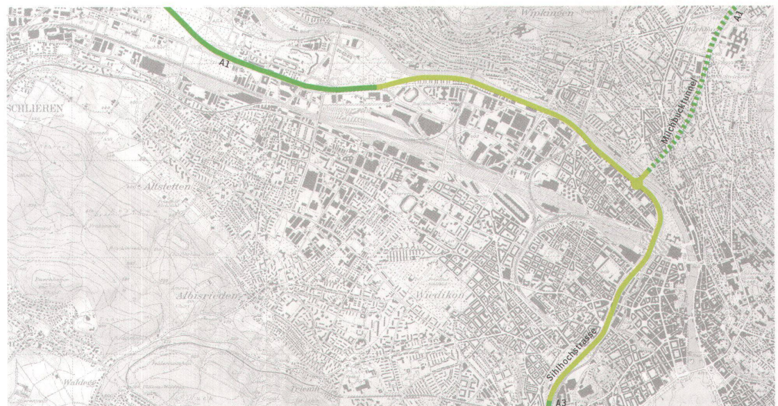
Das Ypsilon, das die Planer in den Sechzigerjahren planten: Entlang der Limmat und über der Sihl von West nach Süd, durch den Tunnel Richtung Nord und Ost.

In der Innenstadt wollen die Planer die Ypsilon-Fragmente miteinander verknüpfen: Der Abschnitt Rosengartenstrasse der provisorischen Westtangente würde zwischen Buchegg- und Wipkingerplatz unter den Boden gelegt, auf die bestehende Hardbrücke geführt und über zwei Rampen an die Pfingstweidstrasse – den verlängerten Arm der A1 – angeschlossen. Vom Ende der A3 beim Sihlhölzli soll die Sihltiefstrasse, neu Stadttunnel genannt, mit einem zweiten, tiefer liegenden Milchbucktunnel verbunden und zur A1 Richtung Winterthur geführt werden. So sah das offizielle Projekt des Kantons aus, und das Ypsilon wäre, wenn auch verkrüppelt, erhalten geblieben. Der Seetunnel, nie Teil des Nationalstrassennetzes, ist zugunsten des Stadttunnels gestrichen worden. Der gehörte als Sihlhoch-, später Sihltiefstrasse stets zum Nationalstrassennetz. →