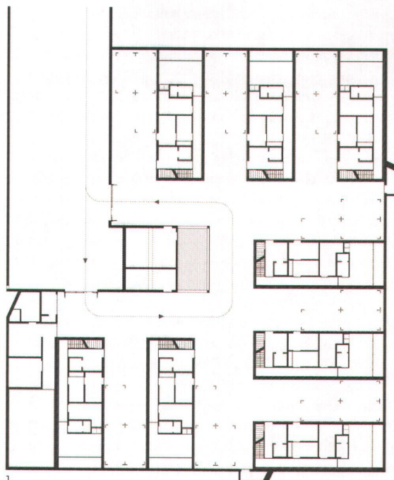
1 Die Tiefgarage der Wohnsiedlung Broëlberg wird mit acht Kuben gegliedert, in denen Kellerräume und Aufgänge liegen.