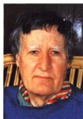
Lucius Burckhardt, Soziologe

«Ich warne davor, den SWB dadurch retten zu wollen, dass der Akzent wieder auf die Silbe «Werk» gelegt wird. Die Betonung des «Werks» um 1907 war eine Kriegsmaschine, die den philosophierenden Akademismus der Kunsthochschulen bekämpfen sollte. Dazu eine Erinnerung: Als ich 1962 bis 1972 an der ETH Zürich Vorlesungen hielt, lief ich einem Kollegen in die Arme. «Kommen denn noch Studenten zu Dir?», fragte er. «Warum sollten sie nicht?» «Weil sie jetzt arbeiten müssten», war seine ermutigende Antwort! Die Schweiz hat im vergangenen Jahrzehnt bewiesen, dass die Haltung «wir arbeiten halt, wir diskutieren nicht lange» nicht zum erhofften Erfolg führt. Vorbild bleibt Italien, wo man von 1960 an diskutierte und nachdachte und zur führenden Design-Nation wurde. Und das Rezept für uns? Seit 1980 predige ich meinen Slogan: «Design ist unsichtbar.» Das heisst, wir müssen die Wirkungen des Designs auf die Lebensweise und die Gesellschaft studieren. Ob ein Autobus nützlich ist, hängt nicht von seiner schnittigen Gestalt ab, sondern vom Fahrplan, vom Tarif und der Lokalisierung der Haltestellen.»