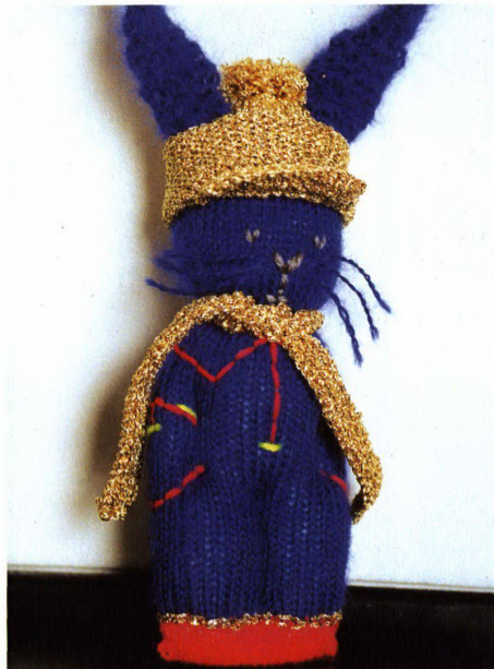
Alle Jahre wieder Hasen in Gold, Silber und Bronze für «Die Besten»

Hochparterre 12/2001 erscheint am 19. Dezember 2001.