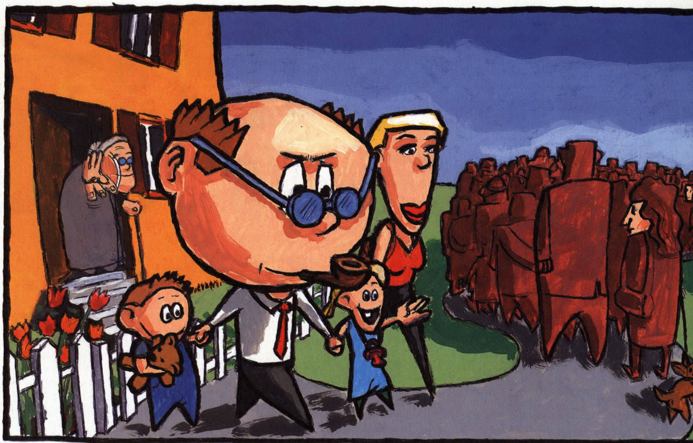
Illustrationen: Gregor Gilg