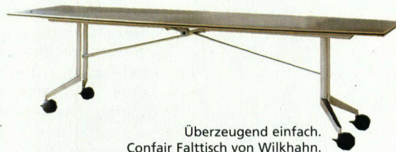
Überzeugend einfach. Confair Falttisch von Wilkhahn.