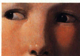
Gilbert Adair Der Schlüssel zum Turm

Hochparterre 6-7/2001 erscheint am 13. Juni 2001.