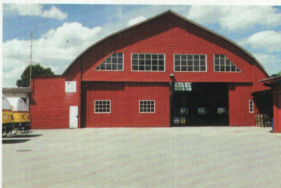
Der Bider-Hangar auf dem Flughafen Belpmoos. Ein Denkmal von nationaler Bedeutung

Hochparterre 12/2000 erscheint am 18. Dezember 2000.