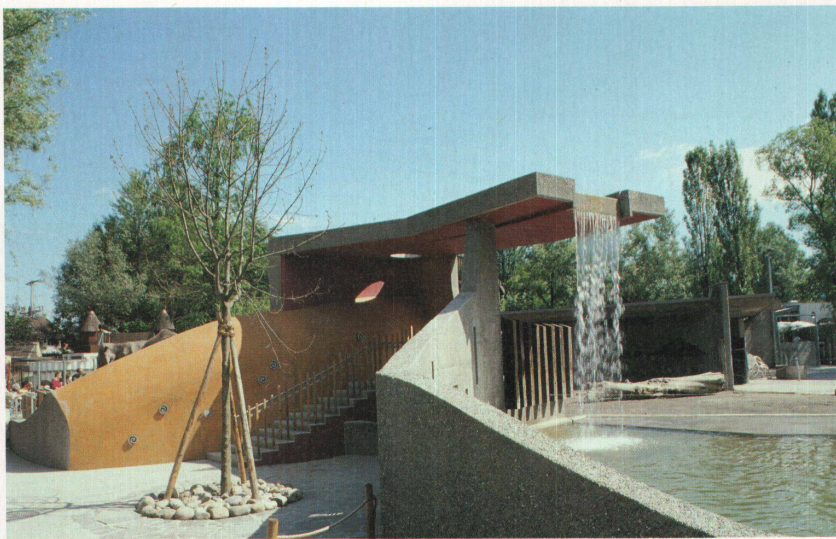
Aussichtsplateau (unter dem Wasserfall) für die Besucher und Dusche für die Elefanten. Die gelb eingefärbte Betonwand trennt Besucher und Elefanten und ist gleichzeitig Elefantenkratzwand