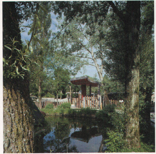
Elefantenreiten: Als indischer Baldachin wölbt sich das rot gefärbte Betondach über die Wandscheiben. Darunter wartet der Elefant, auf dass die Kinder in seinen Sattel klettern